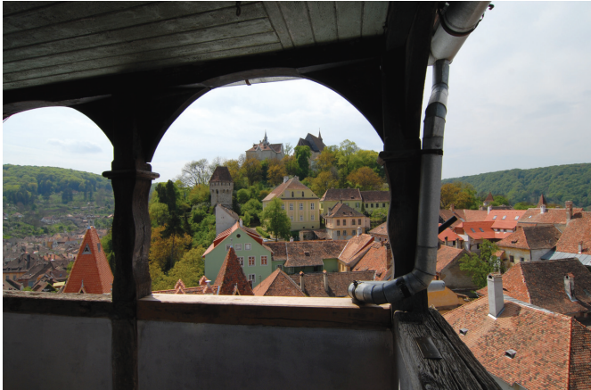
Schäßburg - Blick vom Stundturm auf den Hügel mit der Bergkirche

Der Abstieg erfolgt dann am besten über den Friedhof. Nicht weil der vorhergehende Schnapskonsum dies rechtfertigen sollte, sondern weil der wildromantische ruhige Gottesacker mit den vielen deutschen Namen auf bemoozten Grabsteinen unter uralten, knorrigen Bäumen einen wunderbaren Ausblick auf die umliegenden Hügel bietet. Zum Abschluss empfiehlt sich ein Besuch der Kirche des ehemaligen Dominikanerklo-