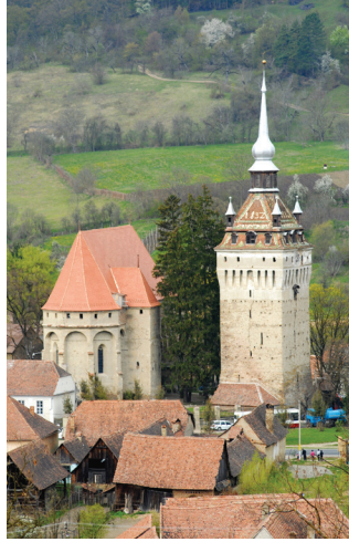
Keisd - Kirchturm

Wenn man auf dem Weg nach Schäßburg in Keisd/Saschiz einfährt, drängt sich sogleich die zerklüftete Burg am Berghang ins Blickfeld und stiehlt der Kirchenburg erst mal die Schau. Ein Aufstieg zu ersterer lohnt schon allein wegen des Panoramablicks ins grüne Hügelland, aus dem das mit bunten Ziegeln besetzte Turmdach der Keisder Kirchenburg wie eine bunte Perle aufleuchtet.