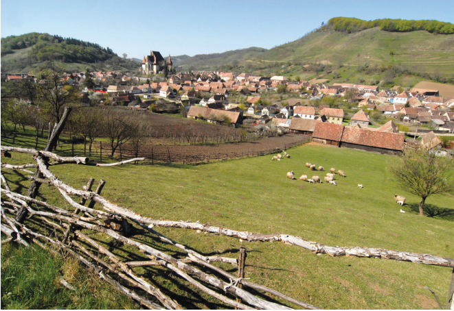
Blick auf Birtihalm mit Kirchenburg

hier auf engstem Raum eingesperrt waren? Sie mussten in einem einzigen Bett schlafen und aus einer gemeinsamen Schüssel mit nur einem Löffel essen. So kamen die Streithähne schnell wieder zur Vernunft - oder sie taten wenigstens so, um der Disziplinierungsmaßnahme zu entkommen.